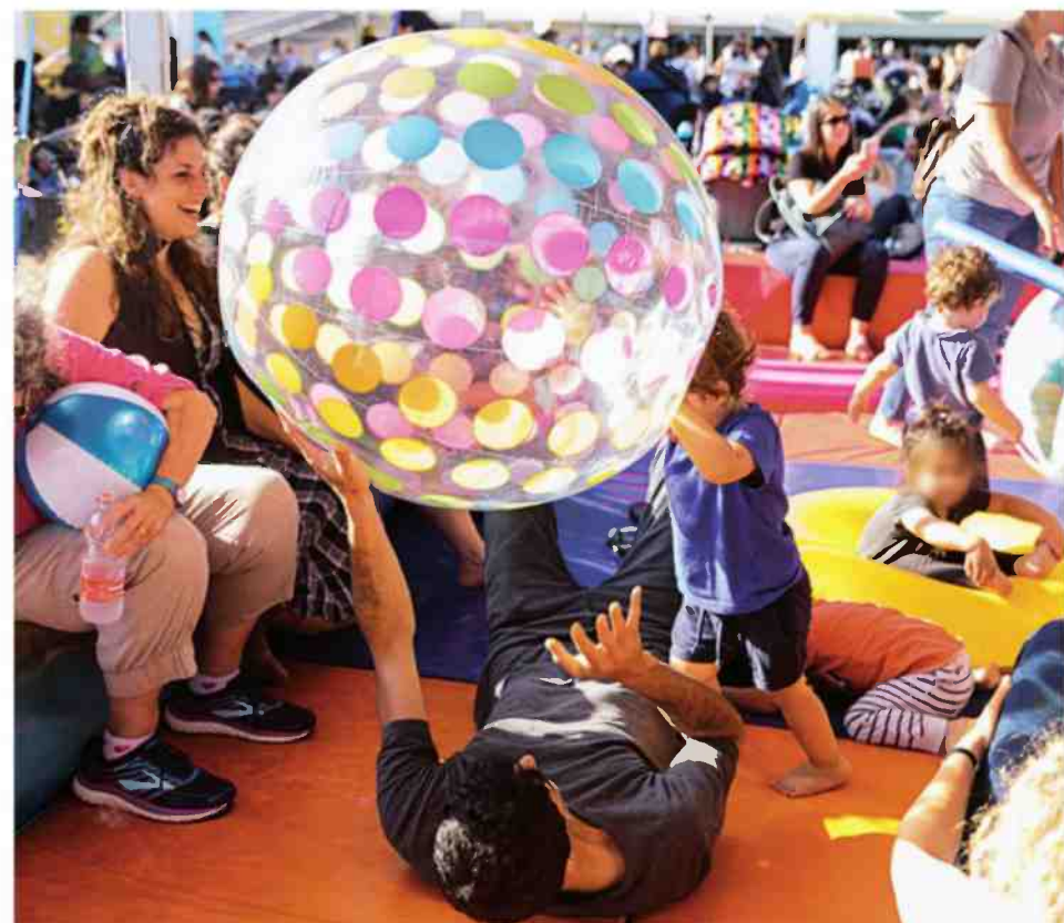
אירוע לילדים בכיכר רבין בתל אביב (מימין), ארגז חול נייד בתל אביב וגן שעשועים ציבורי על שטח פרטי באלעד. "החשיבה על הילדים צריכה להיות מושרשת אצל מתכננים"