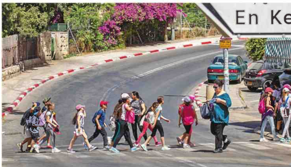
ילדים בירושלים. "הרחוב יכול להפוך נגיש לילדים, ולא רק להוות סכנה עבורם"

"כששאלנו צוותי תכנון מערים שונות היכן הכי נכון לבנות מעון לפעוטות, הסבירו לנו שהי קרבה לצירי התנועה הראשיים ביציאה מהשכר נה לכיוון העבודה היא הפרמטר החשוב ביותר בבחירת מיקום של מעון, ולא הקרבה לטבע או לגינות עם גירויים. כחוקרת, זה היה גילוי מטי לטל; וכחורה, פתאום הבנתי למה כל כך בכיתי ששמתי את הילד שלי במעון סגור עטוף בטוף על כביש ראשי", מודה סילברמן. "השיקול הטכני הגי חה את המתכננים, ולא שאלות כמו אם אני מייצר לילד סביבת חיים בטוחה ובריאה, או אם אני מייצר לו חוויות ומפתח אותו. החשיבה על הילדים צריכה להיות מושרשת אצל מתכננים בדיוק כפי שיוצרים לחשוב על נגישות ומגבלות ניירות למבוגרים וקשישים".